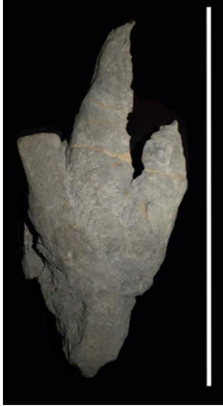
Huella de individuo más grácil procedente de los Acantilados de Argüero en Villaviciosa