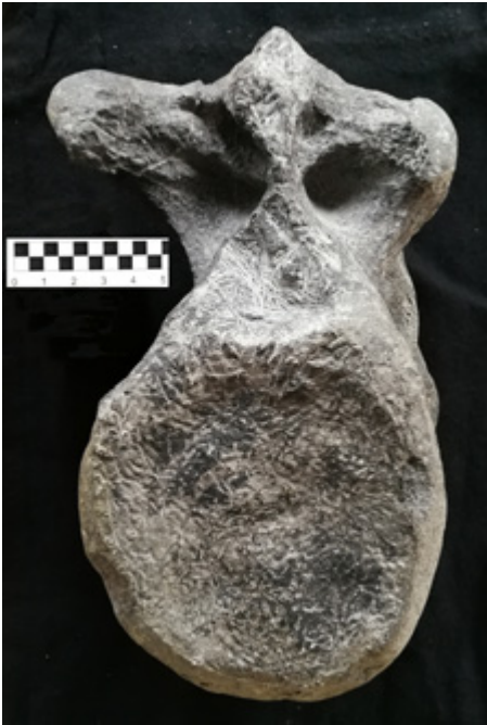
Vértebra procedente de la Playa de Vega en Ribadesella

El material óseo procede de los acantilados de la parte oriental de la playa de Vega (Ribadesella) y está representado por una vértebra caudal de la parte anterior (la segunda o la tercera) perteneciente al mayor dinosaurio carnívoro conocido hasta ahora en Europa, con una longitud superior a los 10 metros. El ejemplar pertenecía probablemente a un Torvosaurus o Megalosaurus , no es posible precisar más, dos de los depredadores de mayor envergadura de la segunda mitad del Jurásico. El tamaño de la vértebra es tan sólo ligeramente inferior a la que poseía en idéntica posición el Tyrannosaurus rex del Cretácico Superior de Norteamérica.